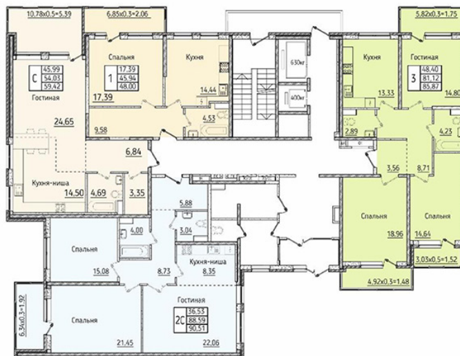
2 этаж - 2 секция

1 - комнатные квартиры 2-х комнатные квартиры 3-х комнатные квартиры