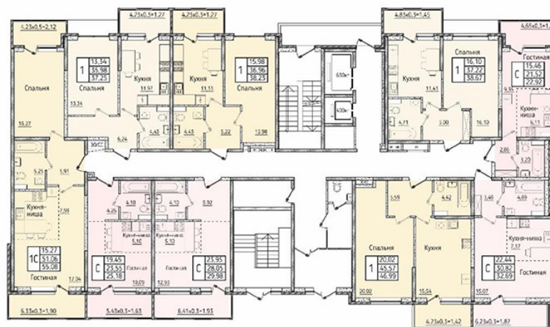
2 этаж - 3 секция

1 - комнатные квартиры 2-х комнатные квартиры Студии